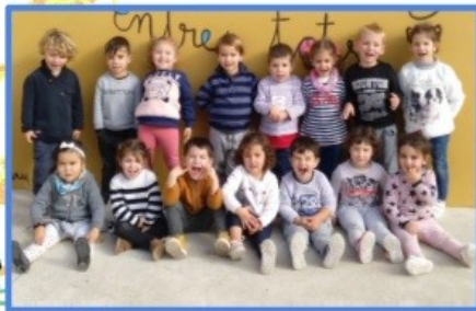
CLASSE DELS TAURONS