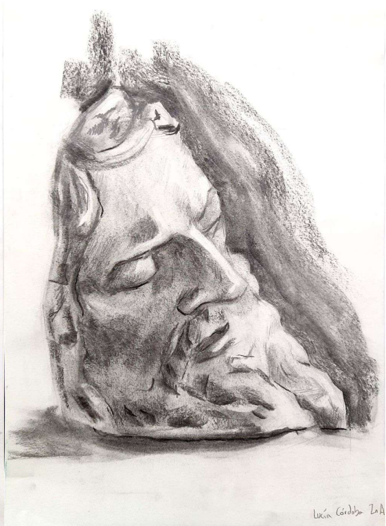
Escaneado con CamScanner