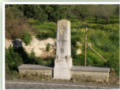
II - Llegua de Marratxí

Quan s'havien de midar longituds més llargues com, per exemple, la distància que hi havia entre dos pobles o entre dues illes, les unitats de mesura eren la Llegua i la Milla .