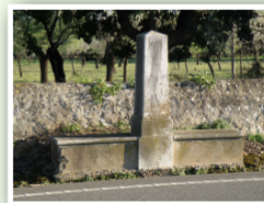
IV - Llegua de Binissalem

A la carretera d'Inca de Mallorca encara es conserven les fites de pedra que marquen les Llegües que hi ha de Palma a Alcúdia. N'hi ha 9 en total i cada una fa, aproximadament, 5 quilòmetres i mig.